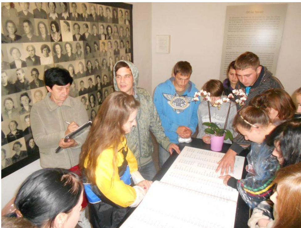
Fot. 22 Młodzież 13-1 Środowiskowego Hufca Pracy w Jędrzejowie podczas zwiedzania obozu koncentracyjnego w Ravensbruck