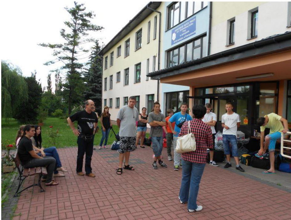
Fot. 8 Odprawa uczestników