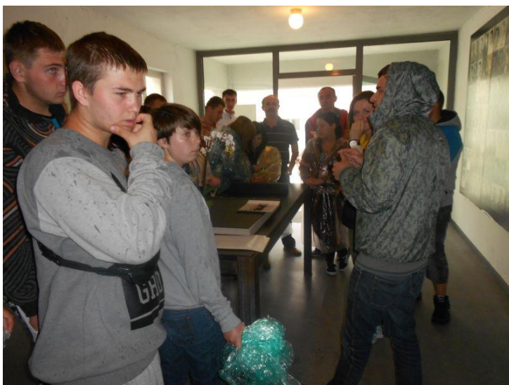
Fot. 17 Młodzież 13-1 Środowiskowego Hufca Pracy w Jędrzejowie podczas zwiedzania obozu koncentracyjnego w Ravensbruck