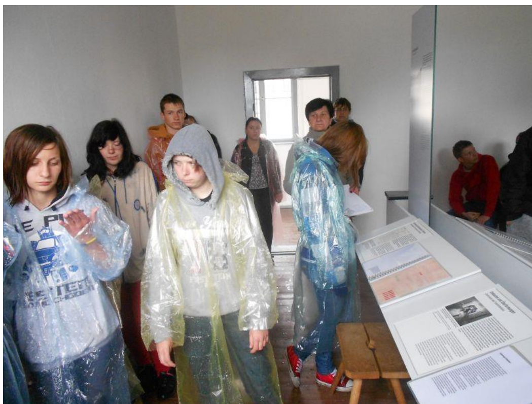
Fot. 23 Młodzież 13-1 Środowiskowego Hufca Pracy w Jędrzejowie podczas zwiedzania obozu koncentracyjnego w Ravensbruck