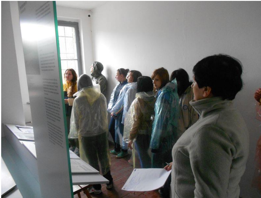
Fot. 24 Młodzież 13-1 Środowiskowego Hufca Pracy w Jędrzejowie podczas zwiedzania obozu koncentracyjnego w Ravensbruck