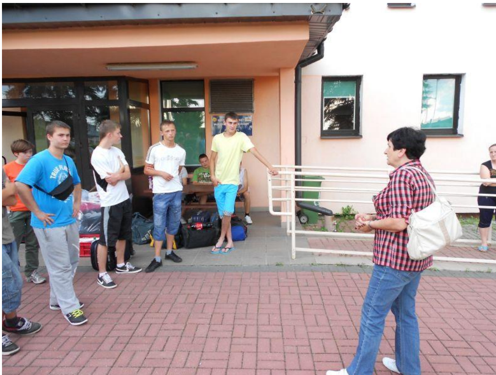
Fot. 7 Odprawa uczestników

„Podróż do miejsc pamięci – Ravensbruck” 24-28.06.2013