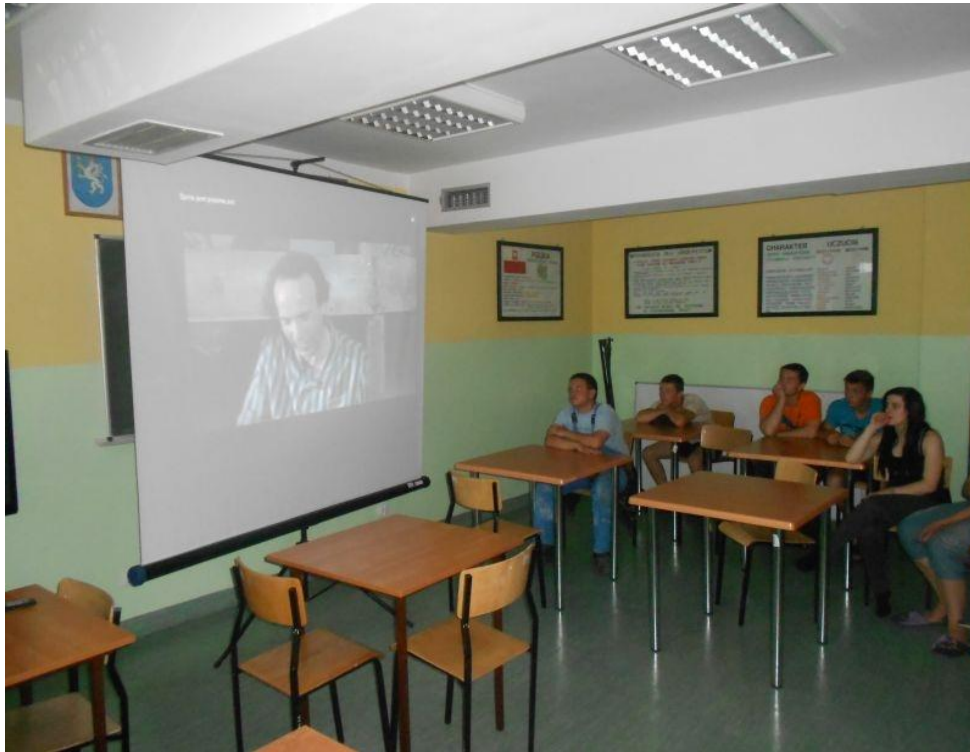
Fot. 4 Projekcja filmu