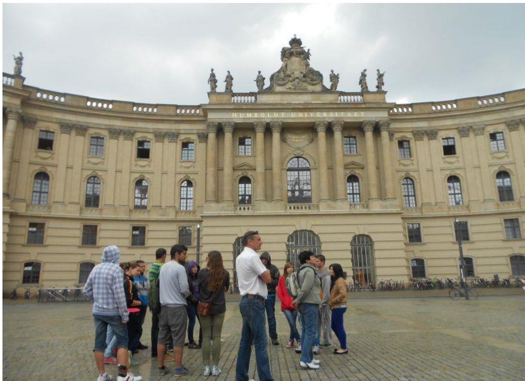
Fot. 29 Uniwersytet Humboldta