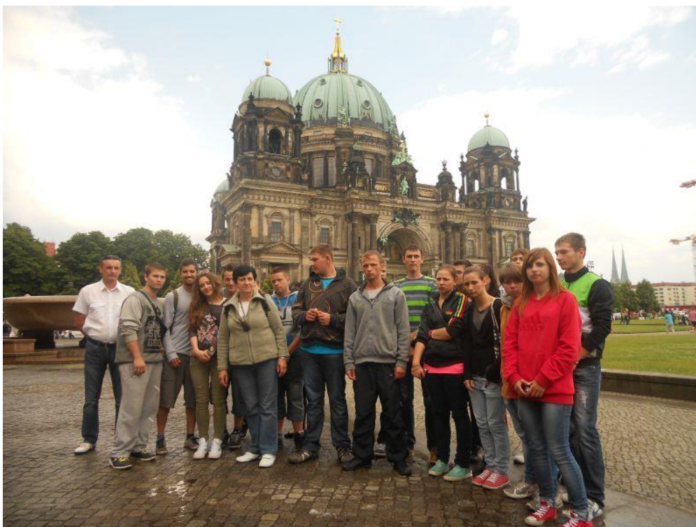
Fot. 30 Katedra Ewangelicka w Berlinie