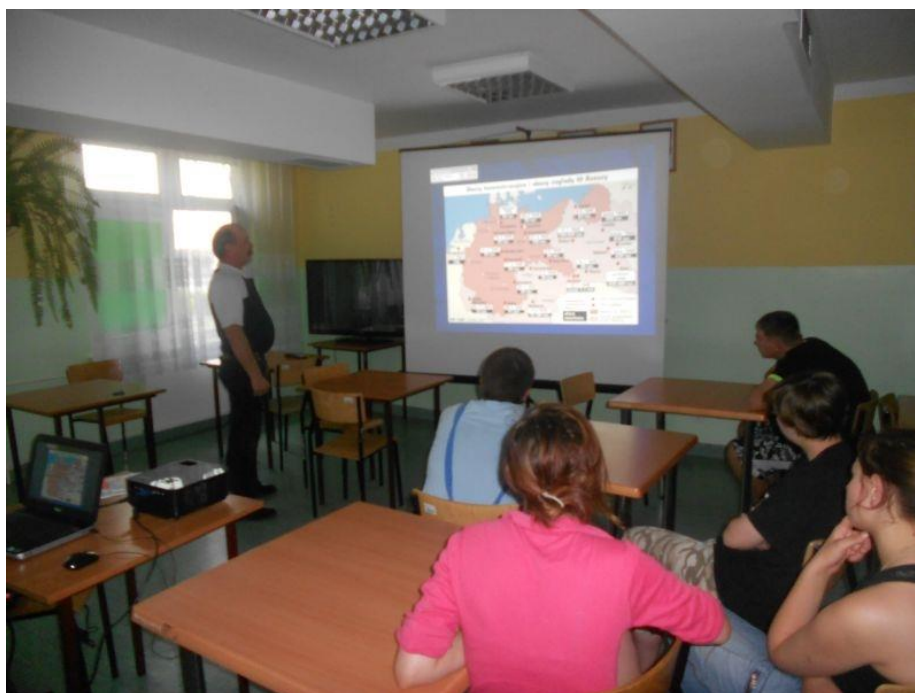
Fot. 1 Wychowawca przedstawia mapę obozów nazistowskich

Seminarium przygotowawcze w 13-1 ŚHP w Jędrzejowie 18.06.2013