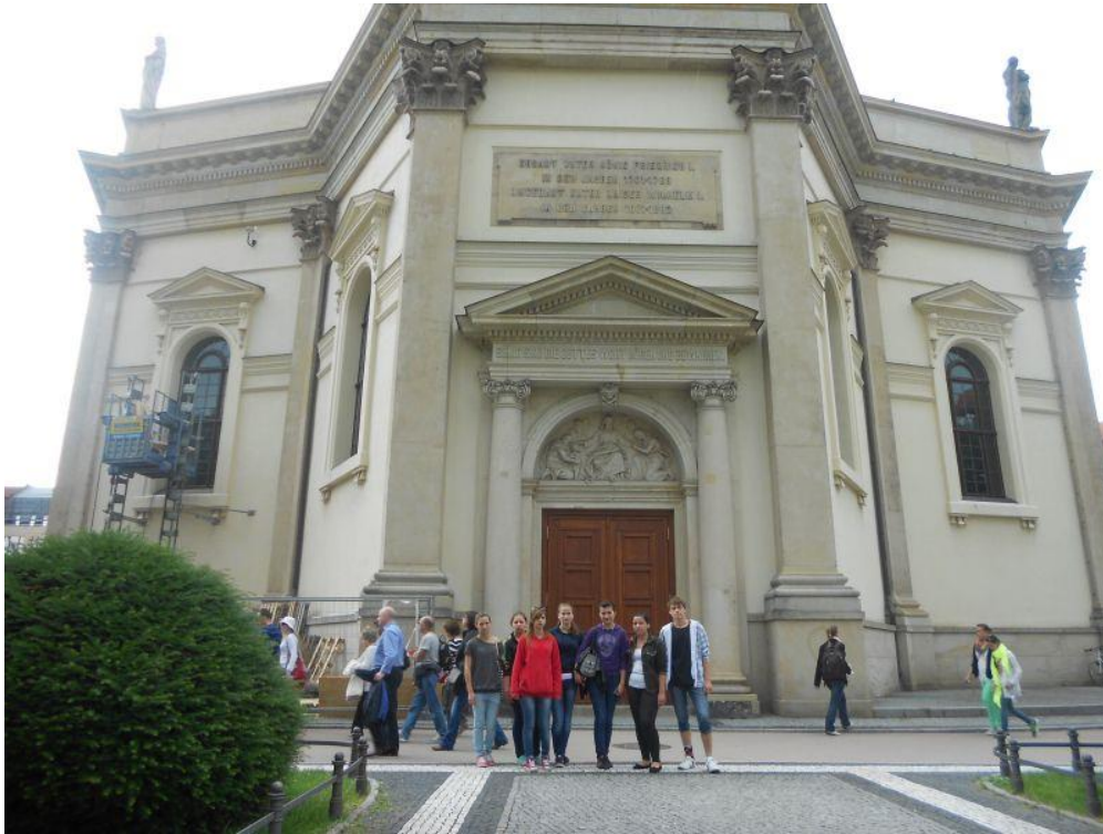
Fot. 28 Sala Koncertowa w Berlinie