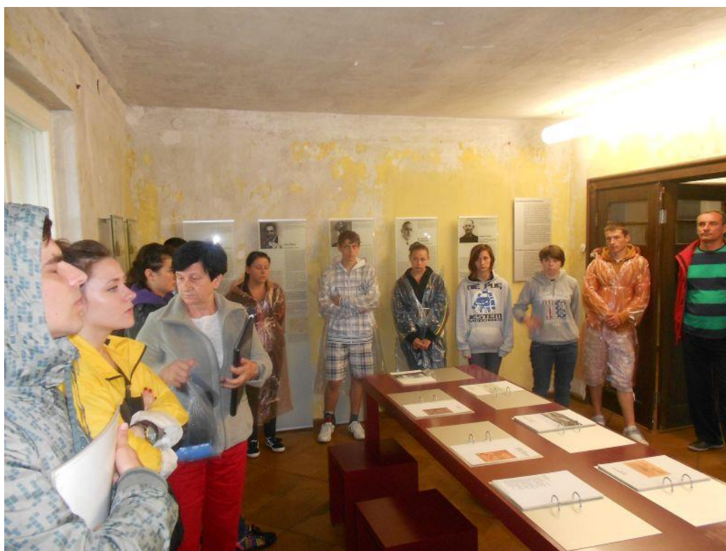
Fot. 19 Młodzież 13-1 Środowiskowego Hufca Pracy w Jędrzejowie podczas zwiedzania obozu koncentracyjnego w Ravensbruck