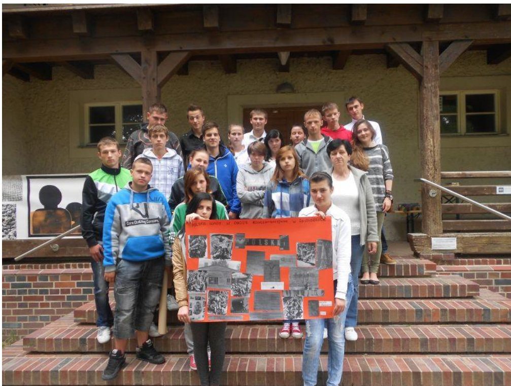
Fot. 14 uczestnicy podczas zajęć na temat polskich śladów w obozie koncentracyjnym Ravensbruck