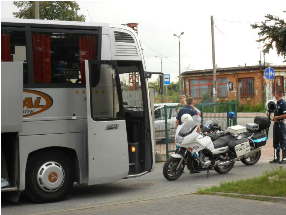
Fot.10 Odprawa uczestników