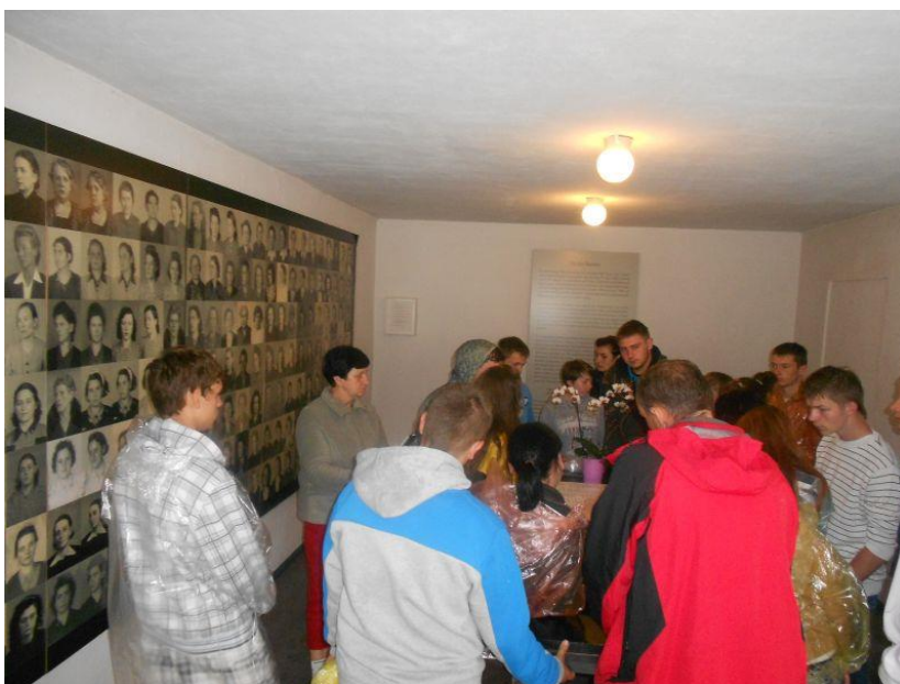
Fot. 21 Młodzież 13-1 Środowiskowego Hufca Pracy w Jędrzejowie podczas zwiedzania obozu koncentracyjnego w Ravensbruck