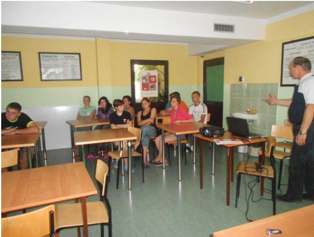
Fot. 5,6 Uczestnicy w czasie zajęć z seminarium

„Podróż do miejsc pamięci – Ravensbruck” 24-28.06.2013