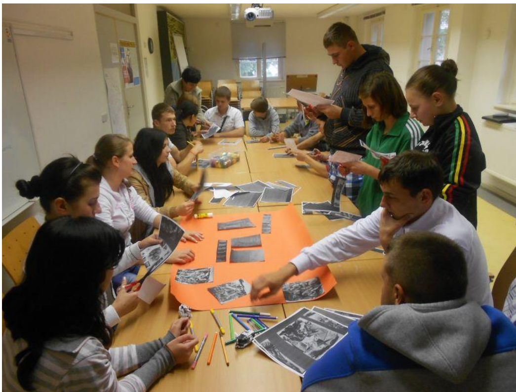
Fot. 12 uczestnicy podczas zajęć na temat polskich śladów w obozie koncentracyjnym Ravensbruck