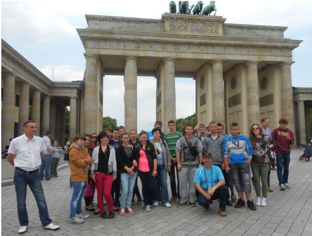
Fot. 26. Przed Bramą Brandenburską