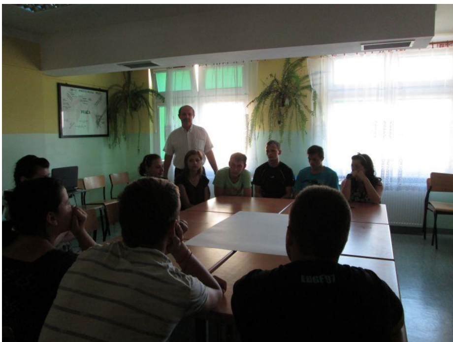
Fot. 31 Rozpoczęcie seminarium