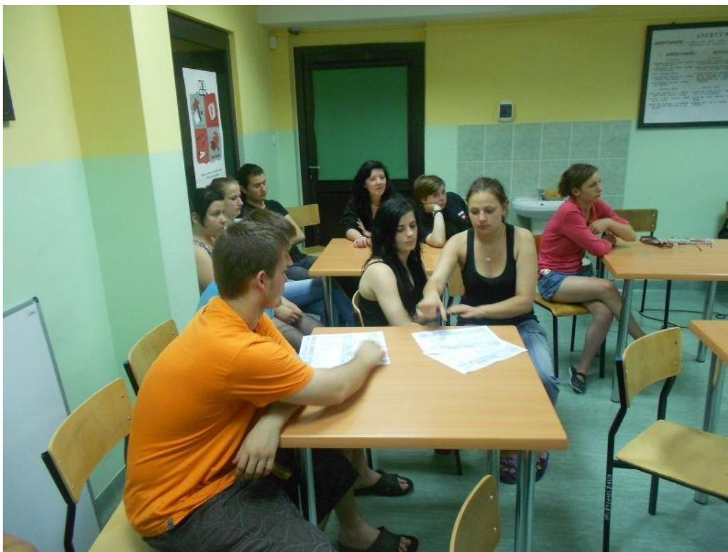
Fot. 5 Uczestnicy w czasie zajęć z seminarium