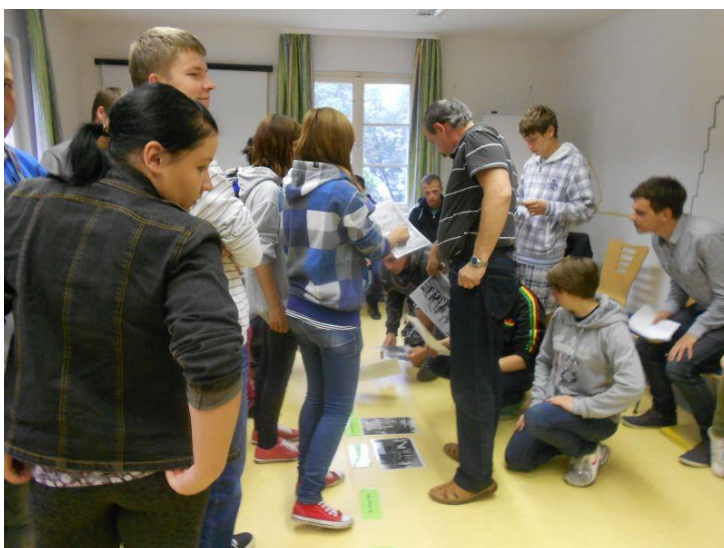
Fot. 15 Uczestnicy podczas zajęć na temat historii obozu koncentracyjnego w Ravensbruck