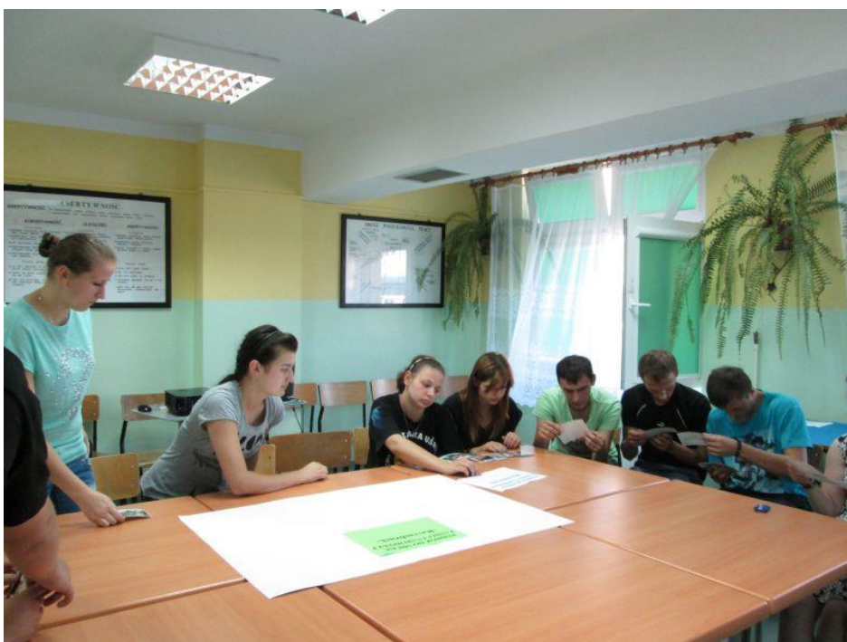
Fot. 33 Uczestnicy podczas wykonywania gazetek upamiętniających pobyt w Niemczech