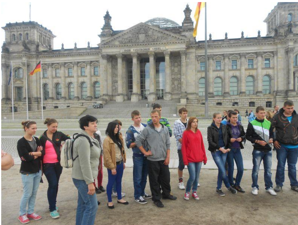
Fot. 25 Uczestnicy przed siedzibą Parlamentu Niemieckiego