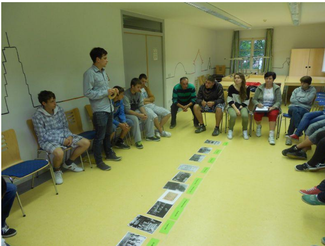
Fot. 16 Uczestnicy ze swoim dziełem