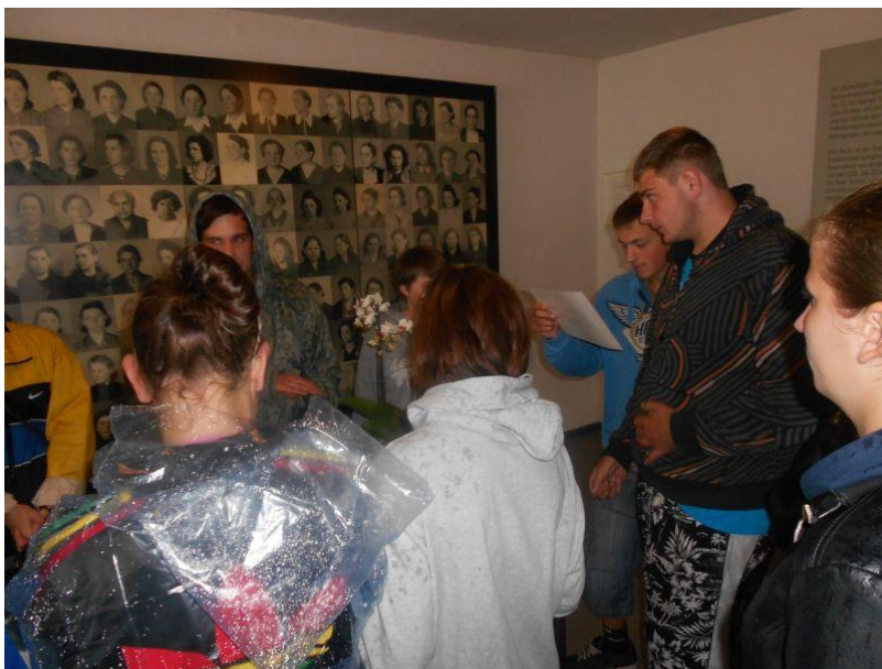
Fot. 20 Młodzież 13-1 Środowiskowego Hufca Pracy w Jędrzejowie podczas zwiedzania obozu koncentracyjnego w Ravensbruck