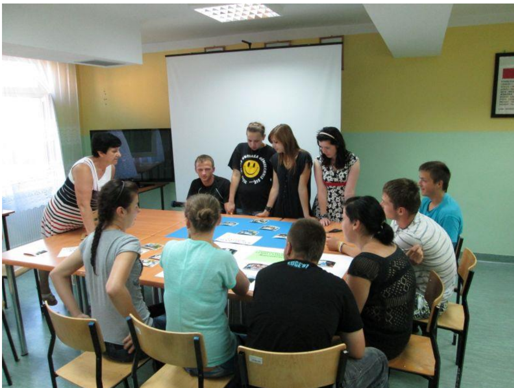
Fot. 35 Uczestnicy podczas wykonywania gazetek upamiętniających pobyt w Niemczech