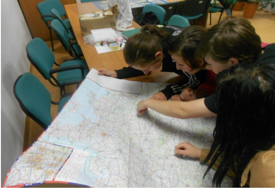
Fot. 2 Analiza mapy Niemiec- szukanie miejsca pobytu