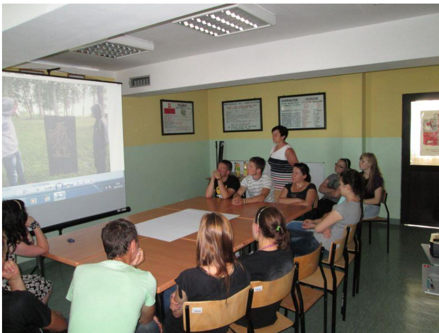
Fot. 32 Wspólne oglądanie zdjęć