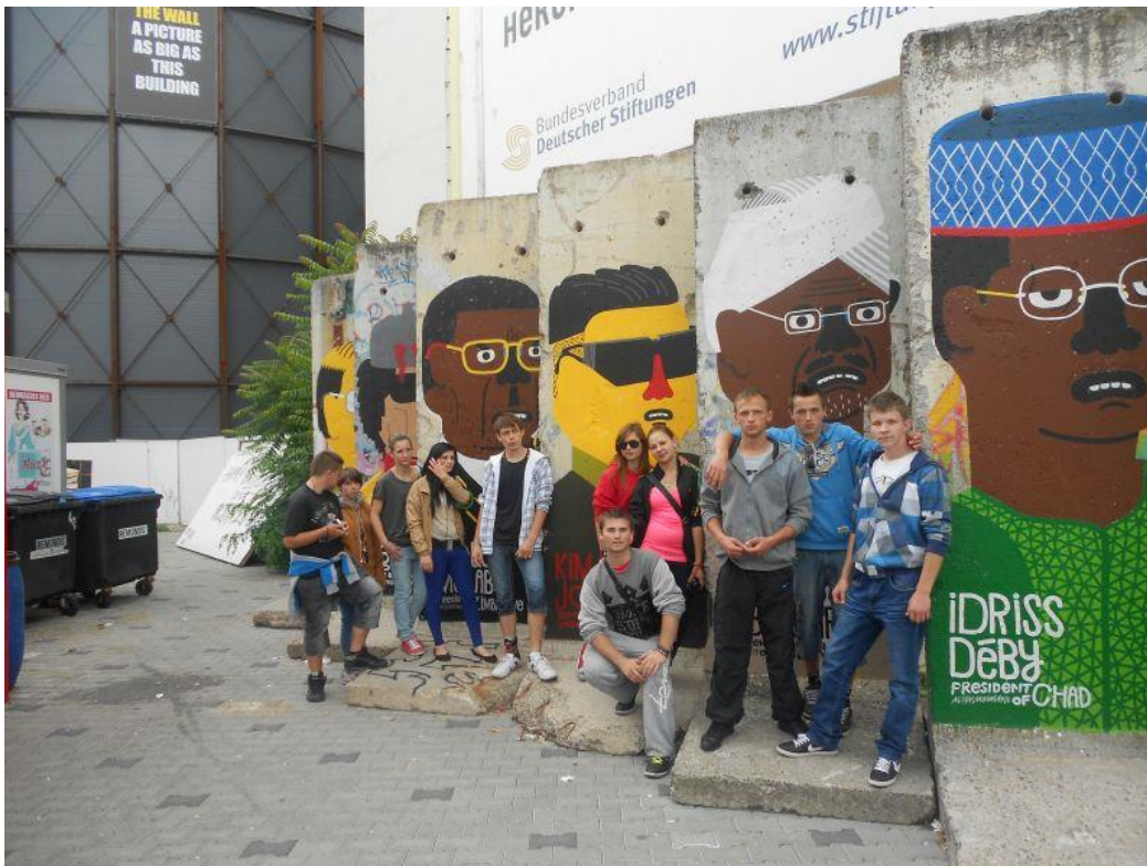
Fot. 27 Mogliśmy obejrzeć również fragmenty Muru Berlińskiego