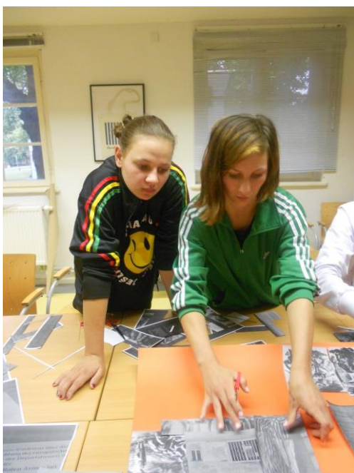
Fot. 13 uczestnicy podczas zajęć na temat polskich śladów w obozie koncentracyjnym Ravensbruck