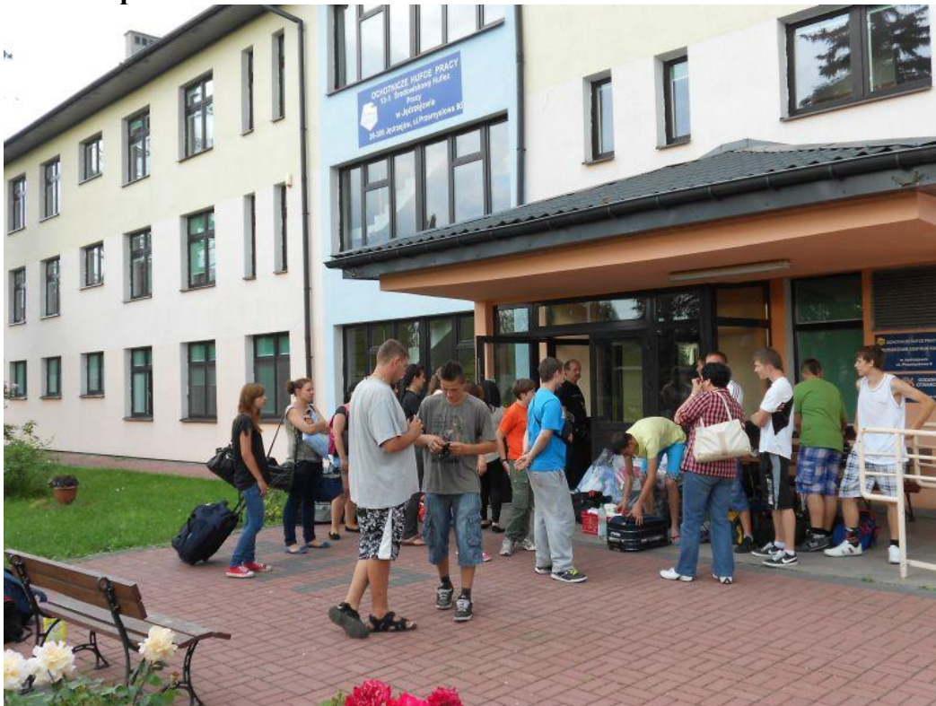
Fot. 9 Odprawa uczestników