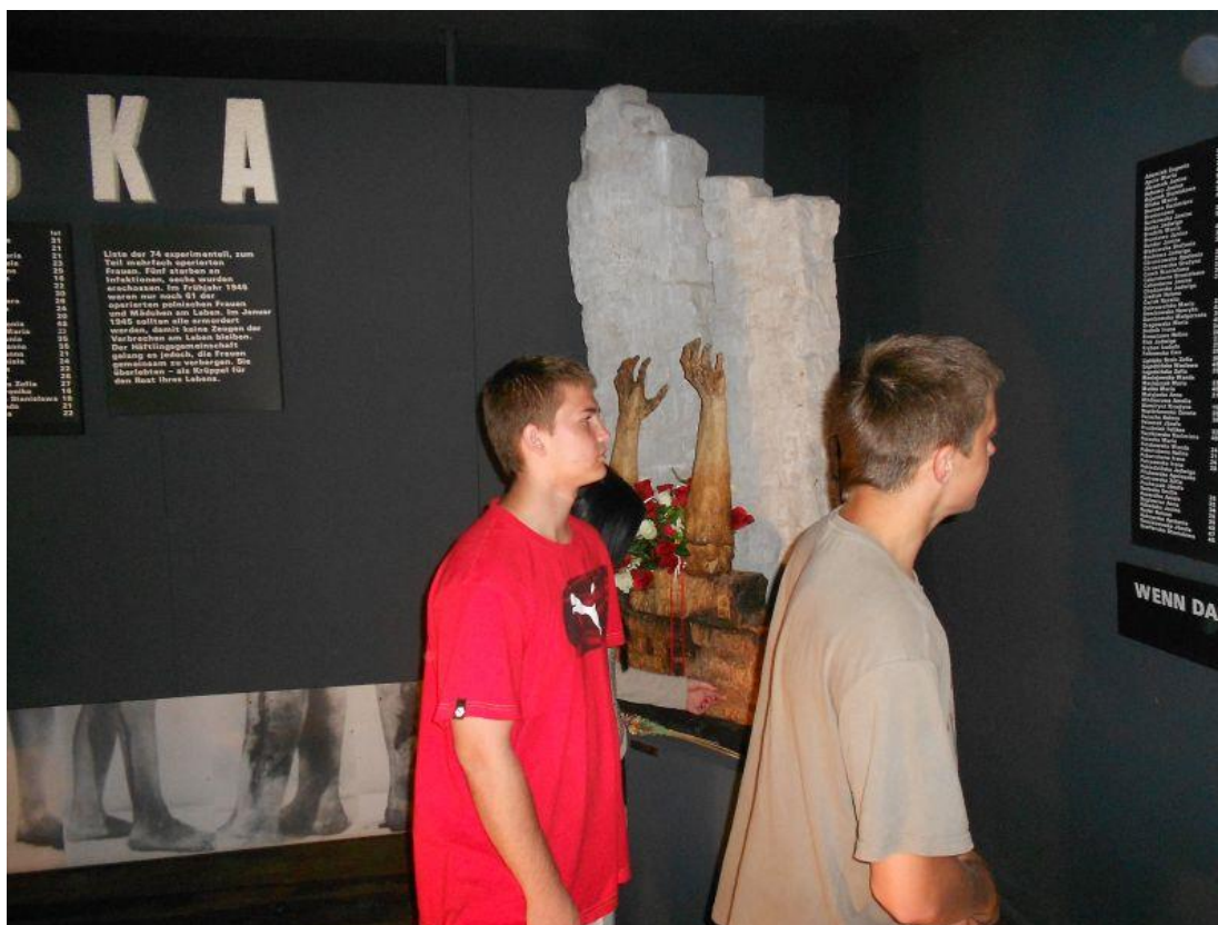
Fot. 18 Młodzież 13-1 Środowiskowego Hufca Pracy w Jędrzejowie podczas zwiedzania obozu koncentracyjnego w Ravensbruck