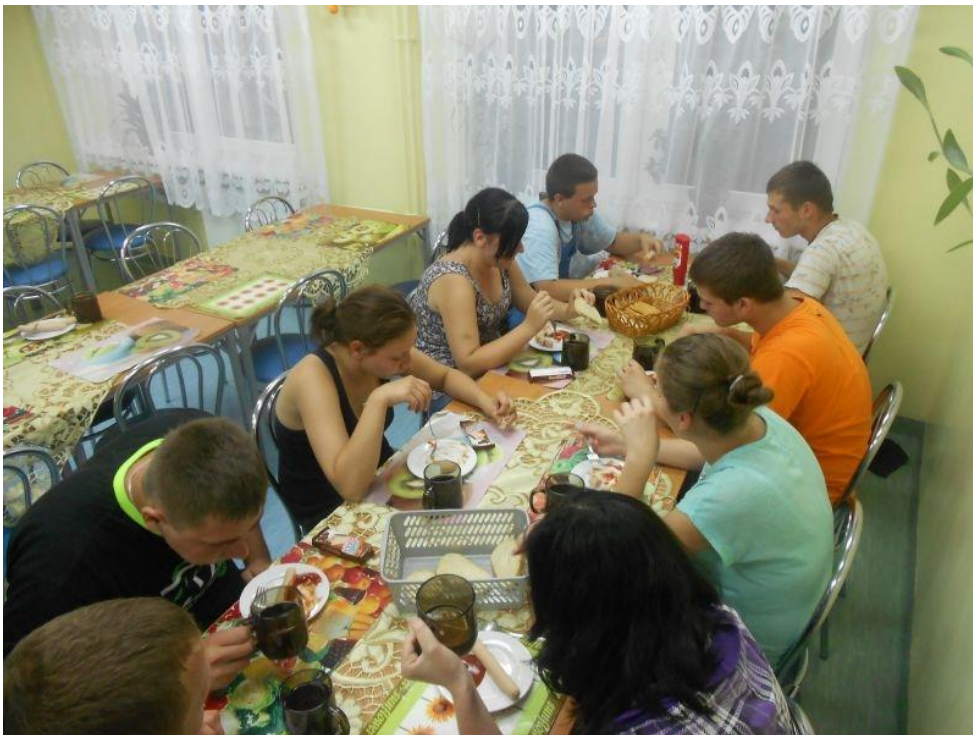
Fot. 3 Wspólny posiłek