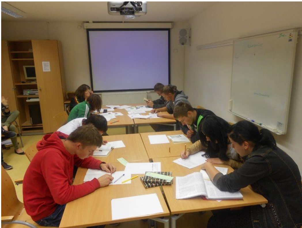
Fot. 11 uczestnicy podczas zajęć na temat polskich śladów w obozie koncentracyjnym Ravensbruck